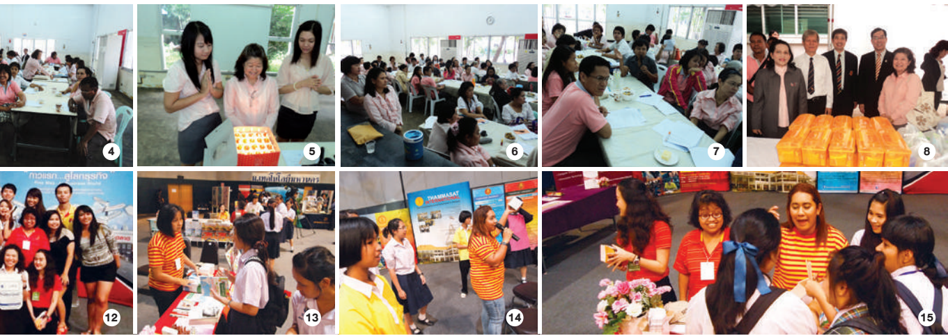
9 » 11 วันที่ 27 มิถุนายน 2555 สท. ร่วมทำบุญตักบาตร เนื่องในโอกาสวันสถาปนามหาวิทยาลัยธรรมศาสตร์ ครบรอบ 78 ปี ณ มธ. ทำพระจันทร์