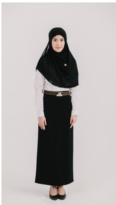
ชุดนักศึกษาบัณฑิตหญิง