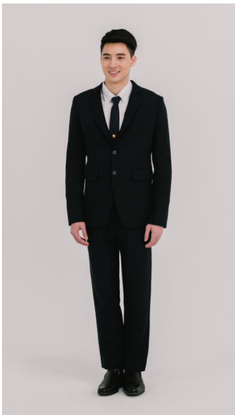
ชุดสูทสากลบัณฑิตชาย